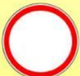
3.2 «Движение запрещено»