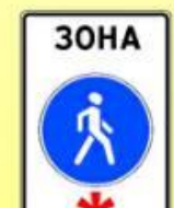
5.33 «Пешеходная зона»