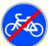
4.4.2. «Конец велосипедной дорожки или полосы для велосипедистов»