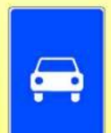
5.3 «Дорога для автомобилей»