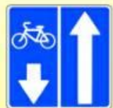
5.11.2. «Дорога с полосой для велосипедистов»