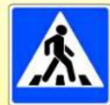
5.19.1. «Пешеходный переход»