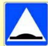
5.20. «Искусственная неровность»