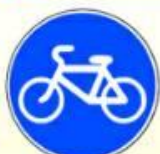
4.4.1. «Велосипедная дорожка»