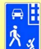
5.21 «Жилая зона»