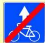
5.14.3. «Конец полосы для велосипедистов»