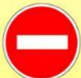
3.1 «Въезд запрещён»