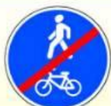
4.5.3. «Конец пешеходной и велосипедной дорожки с совмещённым движением»