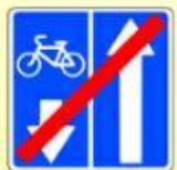
5.12.2. «Конец дороги с полосой для велосипедистов»