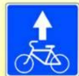
5.14.2. «Полоса для велосипедистов»