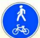
4.5.2. «Пешеходная и велосипедная дорожка с совмещённым движением (велопешеходная дорожка с совмещённым движением)»