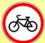
3.9 «Движение на велосипедах запрещено»