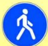
4.5.1 «Пешеходная дорожка»