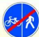
4.5.6. «Конец пешеходной и велосипедной дорожки с разделением движения (конец велопешеходной дорожки с разделением движения)»