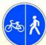
4.5.4. «Пешеходная и велосипедная дорожки с разделением движения»